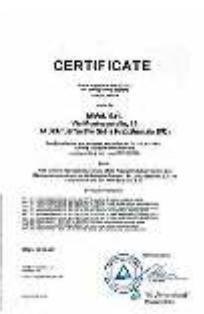
Certificate TA-Luft (VDI 2440)