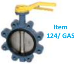
Item 124/ GAS