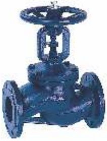
Item 61 flow valve with bellows PN 16 Cast iron EN-GJL-250 body Flanged PN 16 stainless steel stem sealing seats and bellows press Max 16 bar Temp Max + 300° C