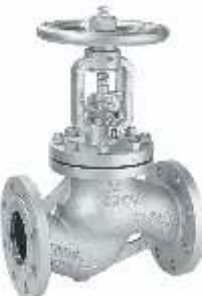
Item 346 flow valve, traditional type PN 40 / A 150 - 300 Carbon steel 1.0619 body Flanged with bellows stainless steelstem bellows and sealing seats press Max 40 bar Temp Max + 400° C