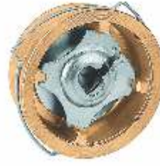
Item 377/BR Disk Check Valve Brass body metal Seated PN16