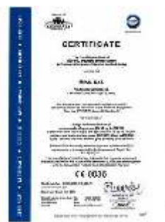
Certificate Pressure Equipment Directive(97/23/CE)