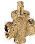
Item 755 /Two-way plug cock - PN 10