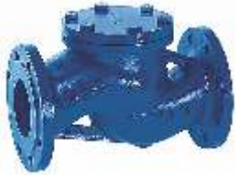
Item 55 flow check valve Cast iron Pn16 St.ssteel sealing seats and disc