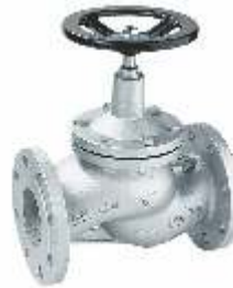
Item 53 flow valve with bellows PN 25 Nodular cast iron EN-GJS-400-18-LT body Flanged PN25 A150 stainless steel stem sealing seats and bellows press Max 25 bar Temp Max + 350° C