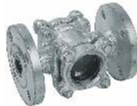
Item 510 Double Glass Flow Indicator Carbon Steel body Flanged Pn25