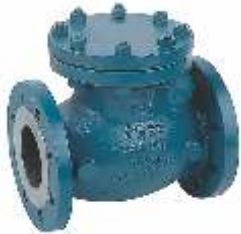
Item 380 Swing check valve Carbon Steel Pn25 St.ssteel Sealing seats Metal Seated