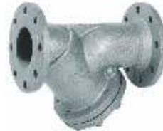
Item 266/25 Y sediment collecting strainer PN 25 Nodular cast iron stainless steel screen