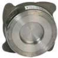
Item 377/I Disk Check Valve Stainless Steel 316 body PN40