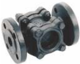
Item 275 Double Glass Flow Indicator Cast Iron body Flanged - Pn16