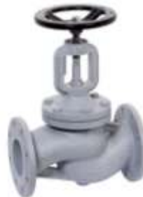
Item 153 flow valve, traditional type PN 25 / A150 Nodular cast iron EN-GJS-400-18-LT body with packing stainless steel stem and seats press Max 25 bar Temp Max + 350° C