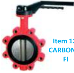
Item 124 CARBONIO FI