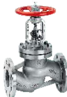
Item 347 flow valve with bellows PN 40 / A 150 - 300 Stainless steel GX5CrNiMo 19-11-2 body Flanged with bellows With stainless steel stem bellows and sealing seats press Max 40 bar Temp Max + 400° C