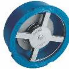
Item 377/GH Disk Check Valve Cast iron body PN16