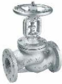
Item 63 flow valve with bellows PN 25 Nodular cast iron EN-GJS-400-18-LT body Flanged PN25 / A150 stainless steel stem sealing seats and bellows press Max 25 bar Temp Max + 350° C