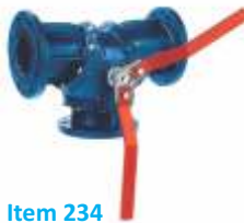
Item 234 Three-way ball valve - PN 16