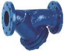
Item 265 Y sediment collecting strainer PN 16 Cast Iron stainless steel screen