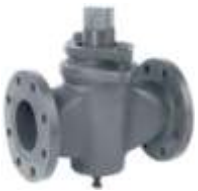
Item 220/Two-way plug cock PN 10