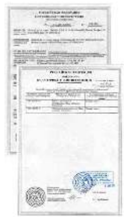
Certificate GOST (on request)