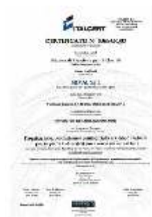
Certificate Quality ISO 9001:2008