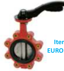
Item EURO 124