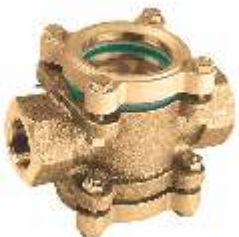
Item 700 Double Glass Flow Indicator Bronze body Threaded BSP Pn16