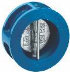
Item 377/GH Double Swing Check Valve Cast iron body EPDM gasket PN16