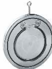
item 376 Swing Check Valve Carbon Steel Pn16