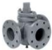
Item 230/Three-way plug cock - PN 10