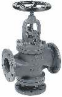
Item 76 Three-way flow valve PN 16 Cast iron EN-GJL-250 body and stainless Steelstainless steel sealing seats angle bore or straight bore press Max 16 bar Temp Max + 300° C