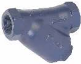
Item 264 Y Type Strainer Cast Iron body Threaded BSP Pn16