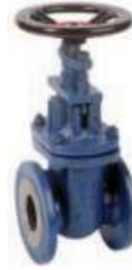
Item 310 Flat body gate valve metal seated - PN 16 Carbon steel 1.0619 body flatbody standard typewith packing stainless steel stem and sealing seats press Max 16 bar Temp Max + 400° C