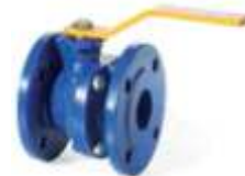
Item 233/GAS Ball valve suitable for GAS - PN 16