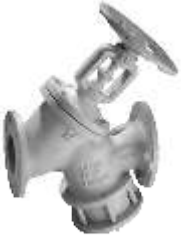
Item 2012 Double function valve maintenance free with bellows Nodular cast iron EN-GJS-400-18-LT body 16 bar / +350° C stainless steel stem sealing seats and bellows Flanged Pn16 On request are available more than 200 alternatives