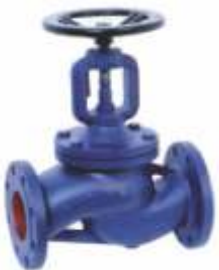
Item 150 flow valve, traditional type PN 16 Cast iron EN-GJL-250 body Flanged PN 16 with packing stainless steel stem and seats press Max 16 bar Temp Max + 300° C