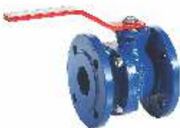
Item 233 Ball valve- PN 16