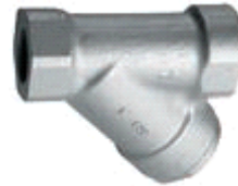
Item 499 Y Type Strainer Carbon Steel A105 body Threaded BSP/NPT Class 800