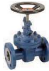
Item 316 Oval body gate valve metal seated PN 40 Carbon steel 1.0619 body oval body Flanged standard typewith packing stainless steel stem and sealing seats press Max 40 bar Temp Max +400° C