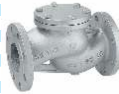
Item 57 flow check valve Cast iron Pn25 St.ssteel sealing seats and disc