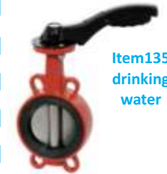
Item 135 drinking water