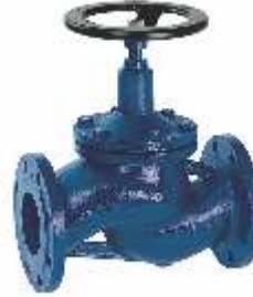
Item 51 flow valve with bellows PN 16 Cast iron EN-GJL-250 body Flanged PN 16 stainless steel stem sealing seats and bellows press Max 16 bar Temp Max + 300° C